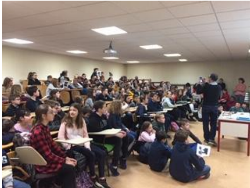
Les réponses étaient attendues via l'application Plickers

via l'application Plickers que les professeurs des écoles utilisent et les enseignants de 6èmes de technologie.